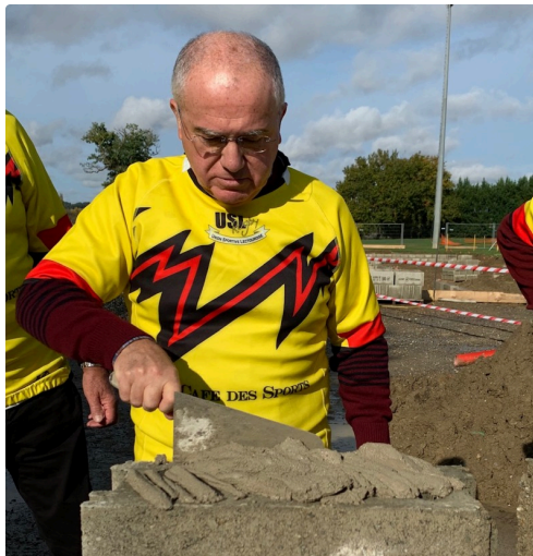
Pose de la pierre, symbole de pérennité et de solidité