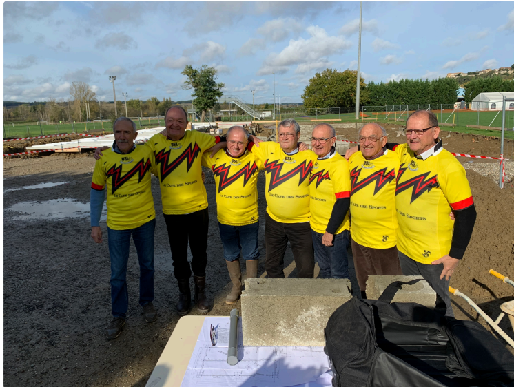
Au stade Vila de Lectoure, la victoire est dans la tribune !

Jour de fête, ce samedi au stade de rugby E. Vila, pour la pose de la première pierre de la nouvelle tribune et des installations.