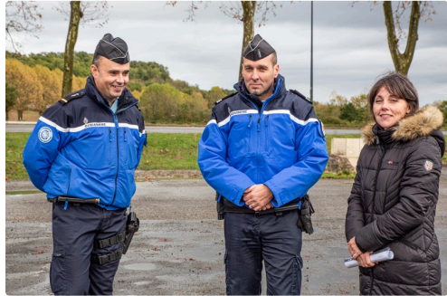
La sous-préfète Delphine Grail-Dumas et le capitaine Clément Pepino accompagnés d'un adjutant

N.B. - La photo du haut de page montre une camionnette de la gendarmerie où un automobiliste en infraction est interrogé.