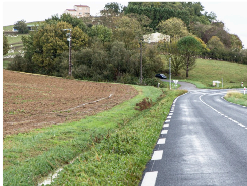
Le poste de contrôle