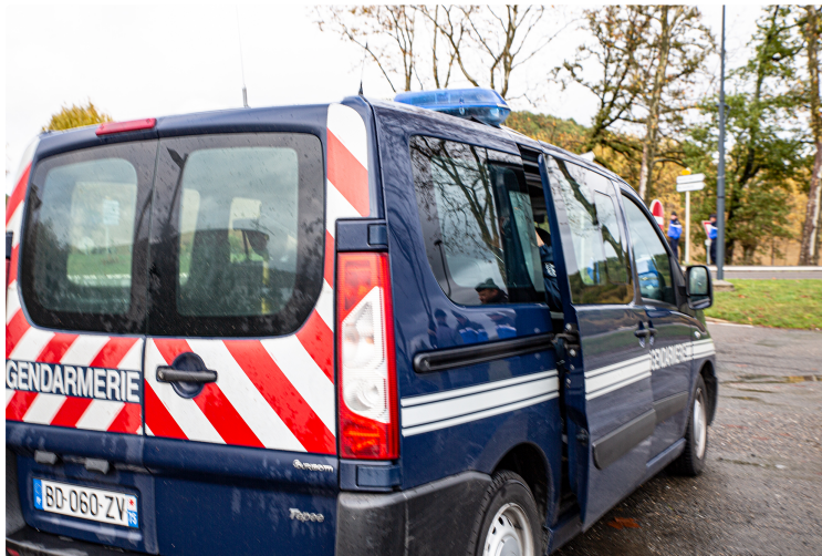
Opération de contrôle routier entre Beaumarchés et Marciac

Contre les infractions génératrices d'accidents graves