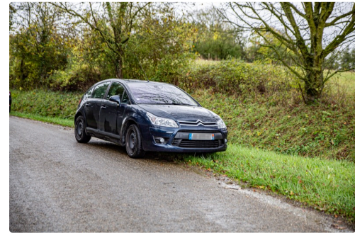
Le même de plus près.