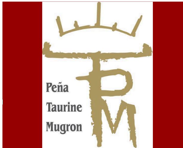
Communiqué de la Peña Taurine Mugronnaise

La Peña Taurine Mugronnaise organise le 20e concours de la nouvelle taurine , prix Jean-Claude Mouchès qui sera décerné à l'occasion des Pâques Taurines à Mugron, le lundi 13 avril 2020.