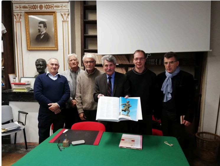
Il est enfin disponible !

Le Mémorial des Gersois morts pour la France entre 1914 et 1918 est sorti d'imprimerie.