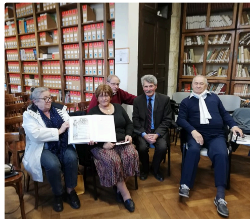
Memorial 06112019 (17) [1280x768].jpg