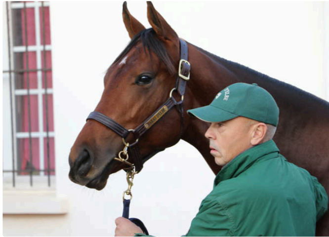
Quand un poulain gersois affole les compteurs à Deauville