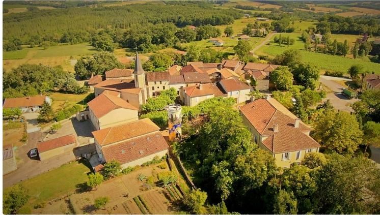
Après le bio, les médecines douces