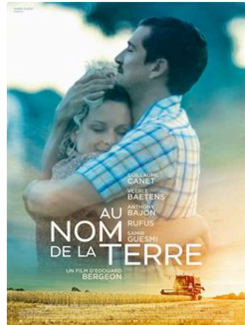
Au nom de la terre.jpg