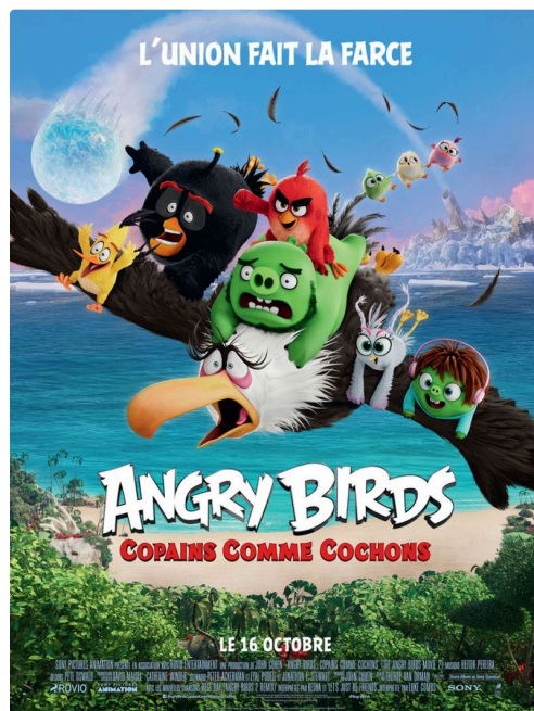
copains comme cochons.jpg