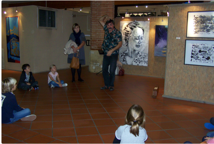
Contes de Gasconha au Musée Campanaire