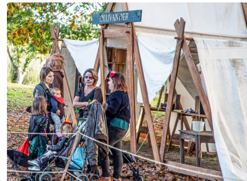
La tente magique Ollivander