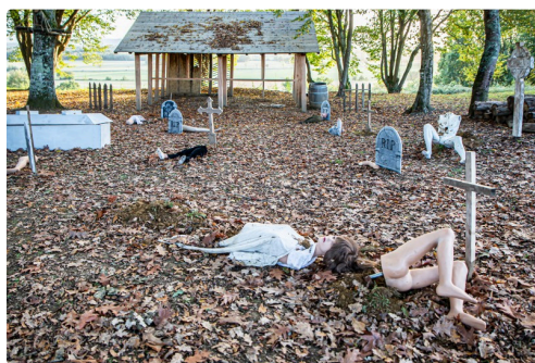
Un cimetière dévasté