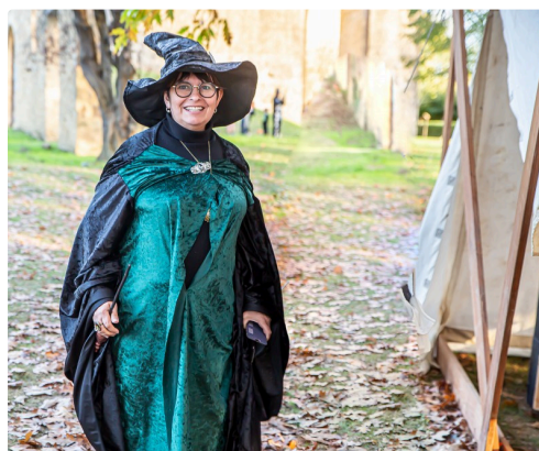
4 Une sorcière sympa 1bis 311019.jpg