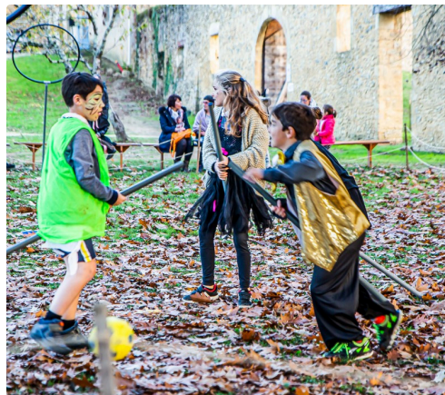
Duel de sorciers avec leur balai