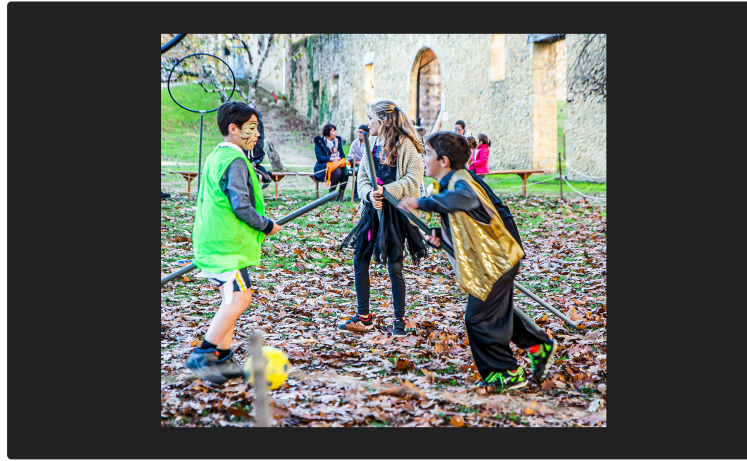
Halloween des enfants à la Tour de Termes-d'Armagnac

Ce jeudi 31 octobre, beaucoup d'enfants sont venus, sur les traces du magicien Harry Potter, profiter de tout ce que l'Académie médiévale et populaire de Termes mettait à leur disposition pour avoir peur et combattre les mauvais magiciens.