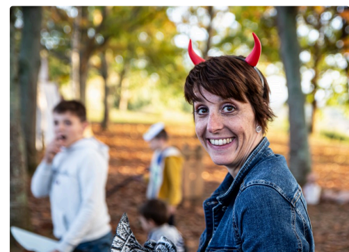
Une maman inquiétante