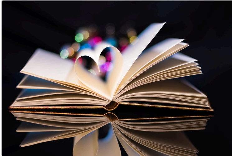
À vos marque-pages !

Chaque premier samedi du mois, le Journal du Gers vous propose une balade chez les libraires et vous révèle leurs coups de cœur du moment.