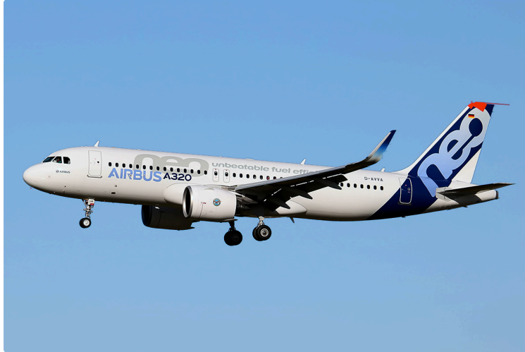
Airbus : décollage record vers l'Inde