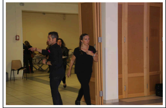
Sur la scène, les paillettes étaient au rendez-vous.