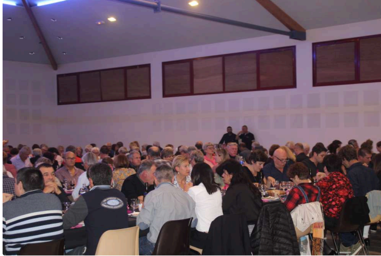
Le tennis club a offert une excellente soirée au public

Samedi soir, au Pôle de Cazaubon, le Tennis Club Cazaubon Barbotan a organisé sa traditionnelle soirée Cabaret.