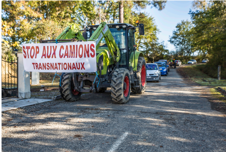
Les anti-poids lourds de la région de Nogaro à Philippe Martin