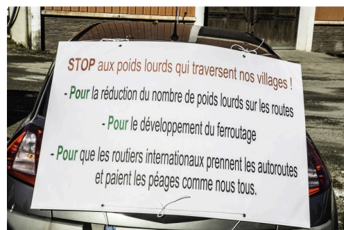
Affiche sur une voiture lors de l'opération "escargot"