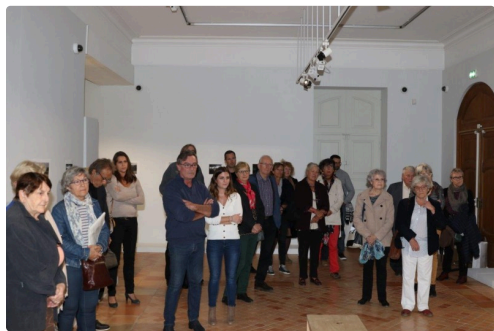
Une partie du public venu assister au vernissage