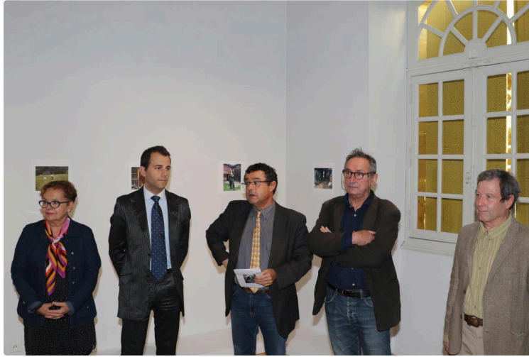
Le 11e sillon tracé dans la campagne polonaise

Exposition La profondeur des Champs, à l'Abbaye de Flaran