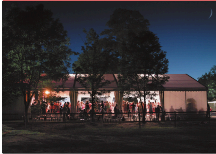
Le grand bal à Saint-Clar