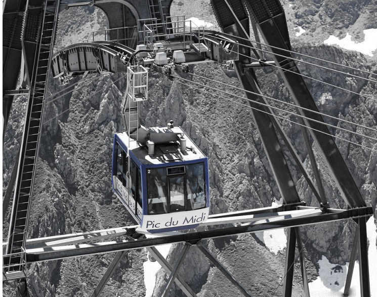
Le Pic du Midi, une révolution au sommet