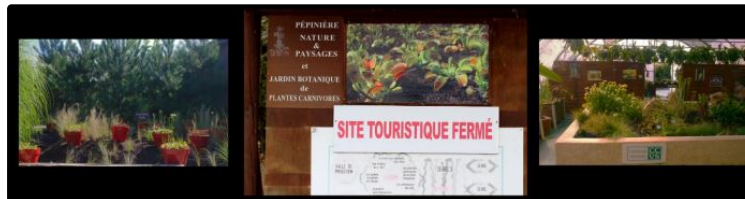
Qui a tué le Jardin Carnivore ?