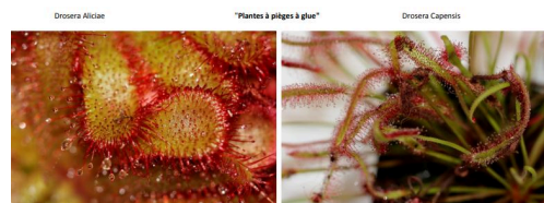
Piège à glue.JPG

Alain Martin (Crédit photo, Alain Martin)