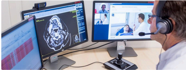
La Cité Saint-Joseph se met à l'heure de la télémédecine

Dans le cadre de la télémédecine pour améliorer la prise en charge des personnes âgées dans son établissement, l'EHPAD de Plaisance-du-Gers a mis en place, dans ses locaux, un tout nouveau système de téléconférence.