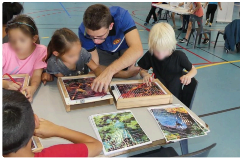
Des explications à la portée de tous