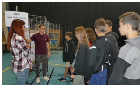
et explications détaillées