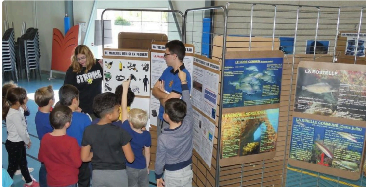
Occit'avenir : les élèves plongeurs du lycée de Mirande à la Fête de la science

Dans le cadre de la fête de la science qui s'est déroulée du 8 au 12 octobre à l'espace culturel de Fleurance, les élèves plongeurs de Mirande ont répondu présents afin de faire découvrir leurs travaux et activités aux plus jeunes.