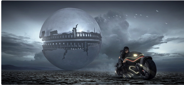
Bizarre, nous vous avons promis du bizarre en double !

... il arrive pour que vous puissiez choisir parmi le programme détaillé de ce Festival ...Bizarre