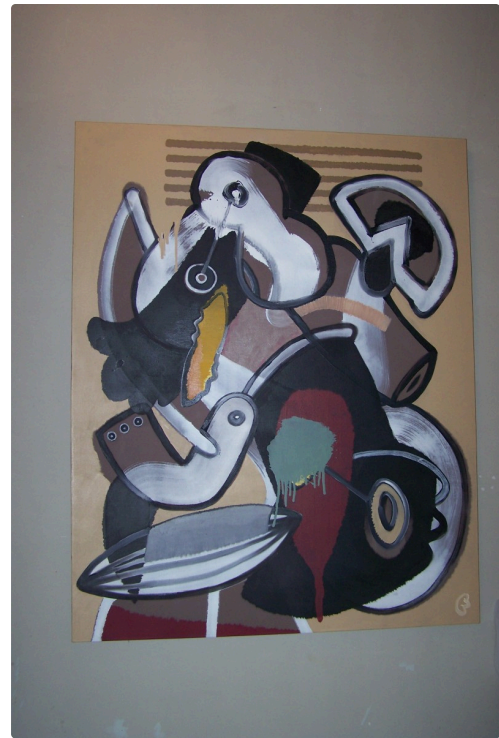
expo jp magnoac et claude cancès st clar 2019 003.JPG