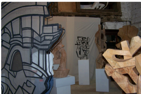
Un autre angle