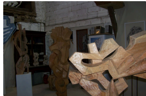
Exposition de ses œuvres dans l'atelier