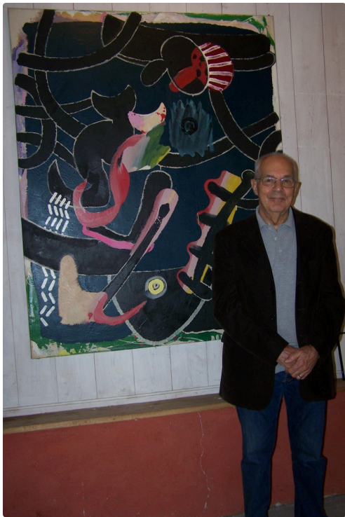
L'artiste devant une de ses œuvres