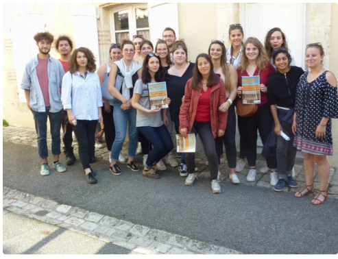
Encore une photo souvenir, mais les élèves seuls !