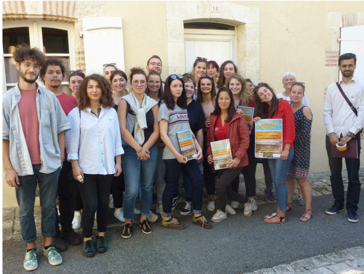
C'est dans la boîte ! Encore faut-il la trouver !

Les étudiants de BTSA du Lycée Beaulieu-Lavacant partenaires de l'Office du Tourisme pour développer le géocaching