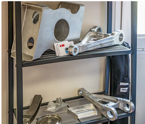
Exemples de pièces fabriquées chez Hueso