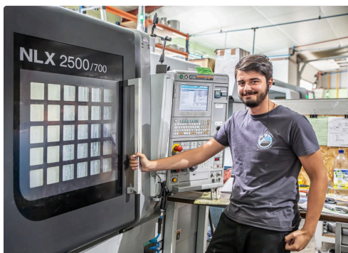
La visite se poursuit