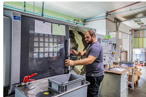
La visite se poursuit