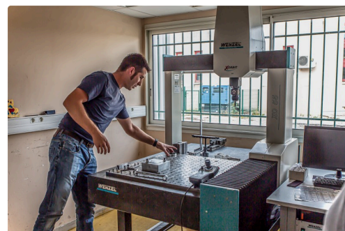
Au contrôle qualité