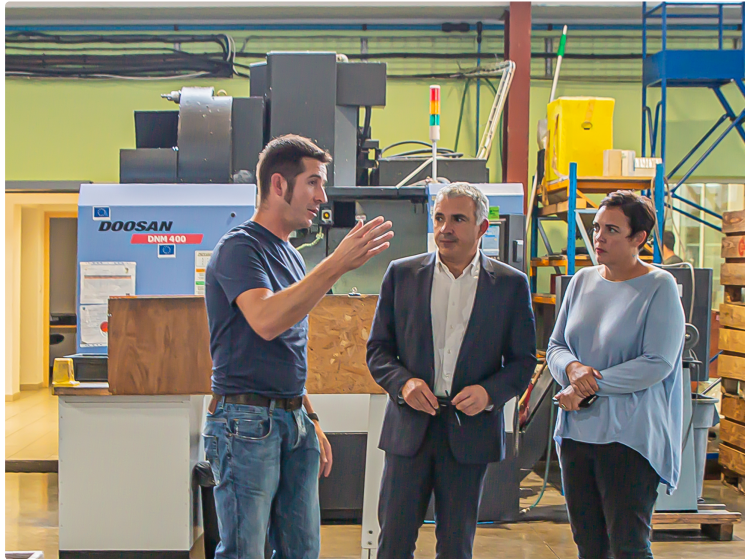
Le président de la CCI visite l'entreprise Hueso à Nogaro

Mécanique de précision, usinage en commande numérique