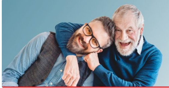
Le Salon des seniors met le cap sur l'emploi

Un job-dating pour les plus de 45 ans, à Pau