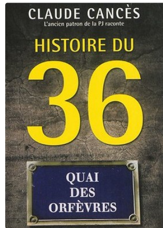
Claude Cancès, auteur de romans policiers, fera découvrir un univers peu connu aux lecteurs