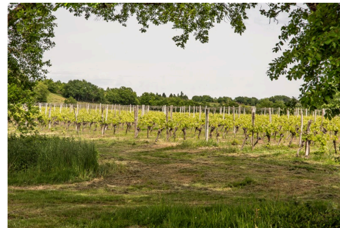
5 Vignes à Sabazan 1bis 070519.jpg