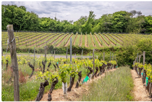
2 Vignes au château Saint-Gô 1bis 070519.jpg