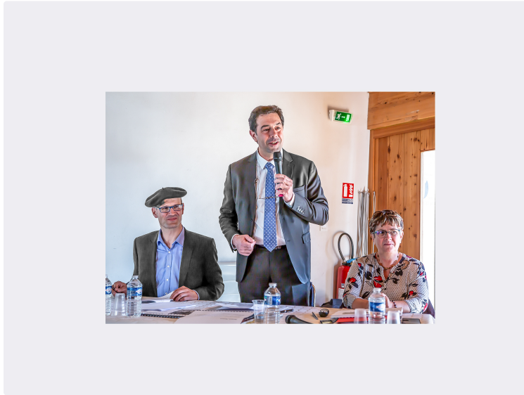
Plaimont obtient la Haute valeur environnementale niveau 3

On sait les efforts acharnés des vigneron de Plaimont Producteurs, passionnés par leur métier pour améliorer sans cesse, depuis 40 ans, la qualité de leurs vins. Récemment, en 2018, La Revue du vin de France déclare Plaimont meilleure coopérative de France. Voilà un signe qui ne trompe pas les gens avertis. Et que vient-il d'arriver au début de ce mois d'octobre 2019 ? La coopérative obtient la certification HVE 3 ou Bio (AB) (1), en 8 mois à peine, pour 500 ha de vignes, soit 10 % de son vignoble.