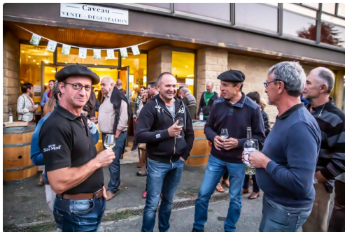
Groupe de vignerons