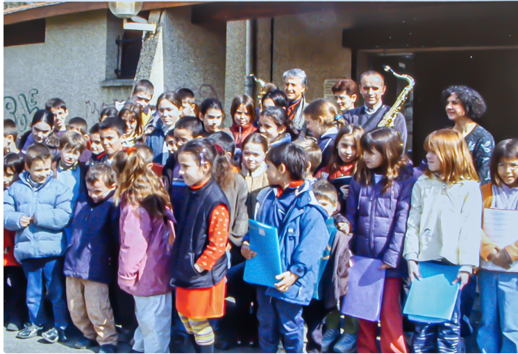
20e anniversaire de l'École de musique d'Artagnan de Lupiac

Avertissement – Le Journal du Gers n'a pas été en mesure d'assister à cette journée d'anniversaire du 28 septembre, marquée par un concert à Vic-Fezensac. Mais l'École lui a transmis des documents d'où est tiré ce qui suit, y compris les photos lorsque c'est indiqué. Les autres photos sont extraites de nos archives. La photo du haut de page est le résultat d'une rephotographie d'un document. Elle représente les enfants élèves de l'École.