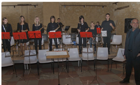
La classe d'orchestre en 2010