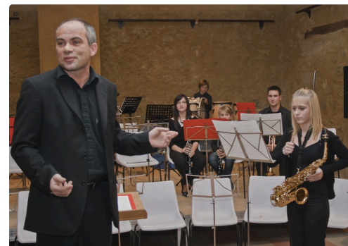
La classe d'orchestre avec saxo soliste en 2010