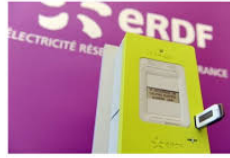
GERS Linky bientôt chez vous