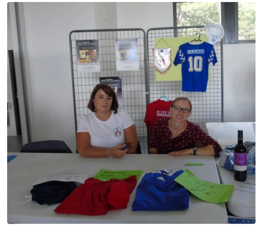
Le stand du foot et sa présidente