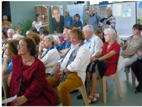
Lors de la projection du film amateur