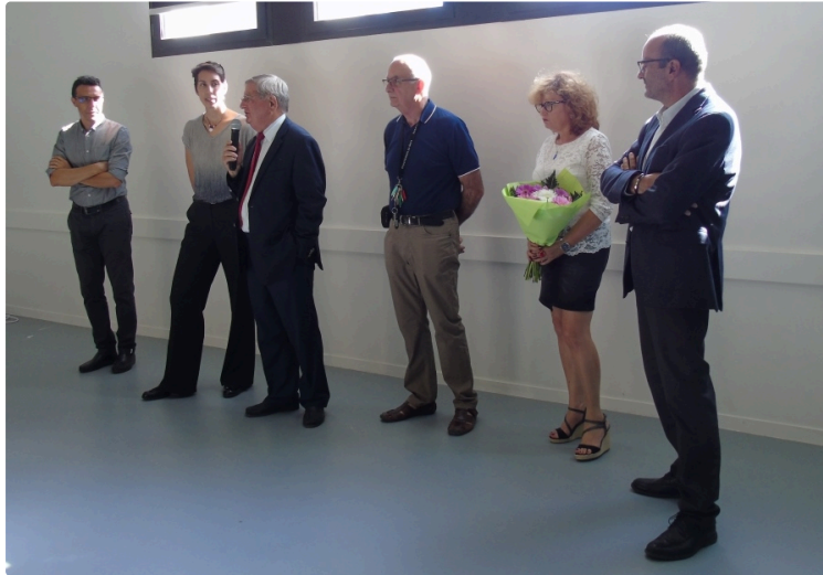
Rétrospective sur 50 ans de vie sociale au Foyer Rural

... des souvenirs, des moments forts et réjouissants