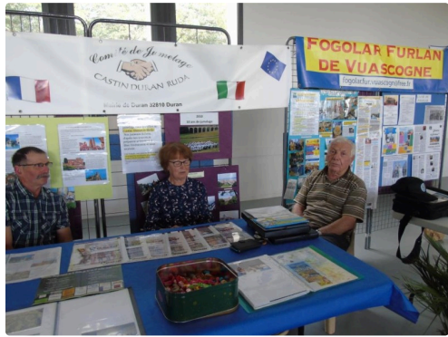
un coin d'Italie