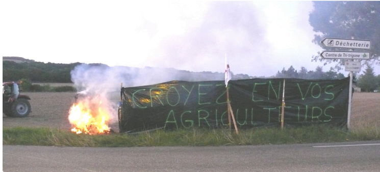
"Feux de la colère" : rendez-vous manqué entre les agriculteurs et "leurs voisins"

À Auch, en face de la zone d'activité de Lamothe, ils étaient une dizaine d'agriculteurs, mais pas le moindre citoyen pour venir dialoguer