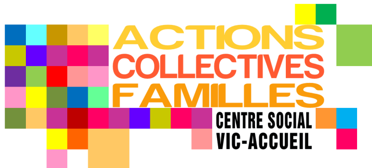
Animations proposées par Vic-Accueil en octobre

Voici les animations proposées par Vic-Accueil au mois d'octobre 2019 :