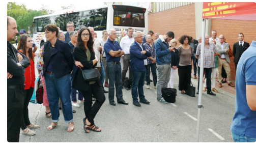
Le public lors de l'inauguration.