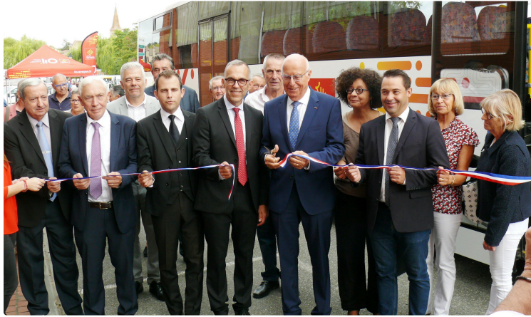
Inauguration de la ligne 954 de car LiO reliant Lombez, Samatan et l'Isle-Jourdain

La Région Occitanie et le Département mettent fin à une attente de la population du Val de Save