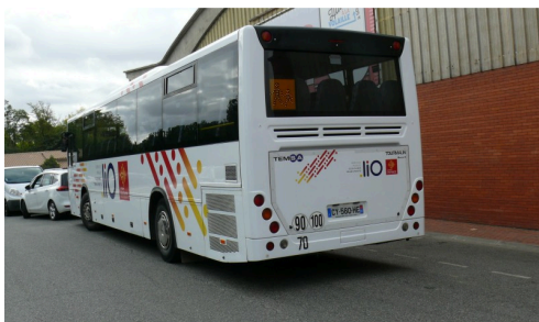
Le car LiO de la ligne 954.