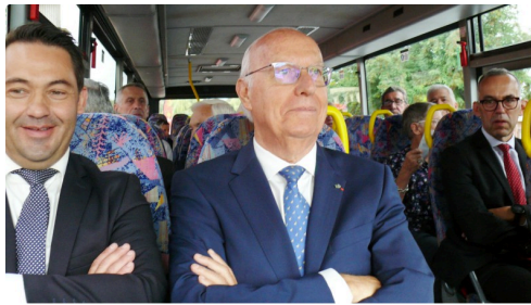
Prêts pour un petit tour de car aller-retour de Samatan à Lombez.