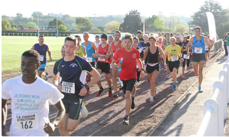
Les Virades de l'Espoir

Ils courent pour le plaisir, mais aussi pour une bonne cause.