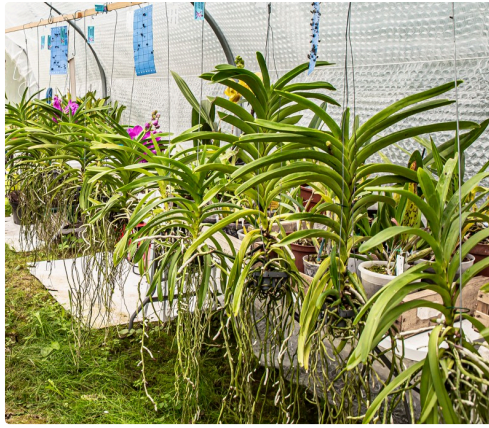
Les Vanda suspendues racines à l'air