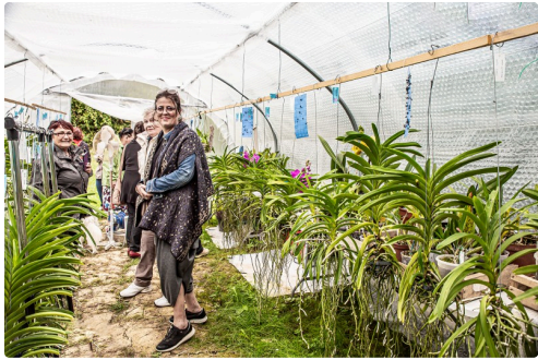
Les Papillons jaunes visitent le tunnel des Vanda