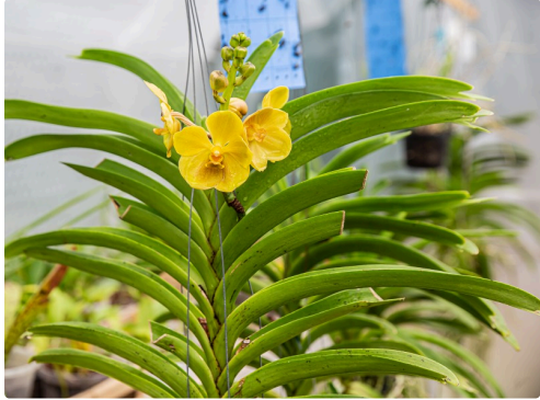
Autre vanda en fleur