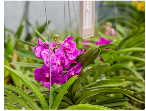
Une vanda en fleur