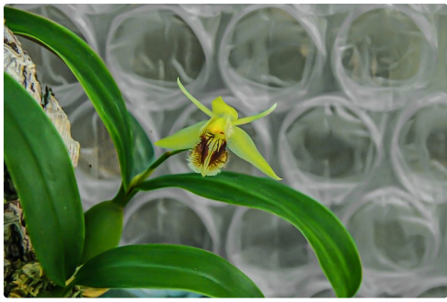
Orchidée coelogyne fimbriata