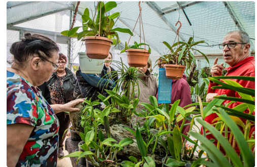
Les Papillons jaunes dans la serre