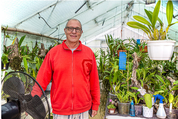
Les Papillons jaunes aux Orchidées d'Avéron-Bergelle

Visite et conseils pour les soins aux orchidées