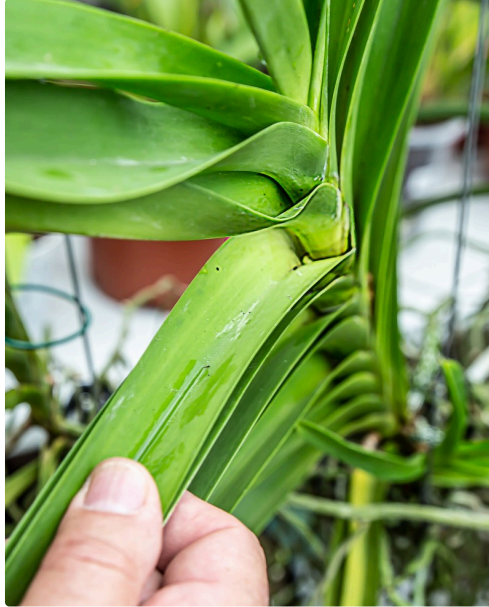
Alain Dumont montre un minuscule bourgeon de fleur entre 2 feuilles