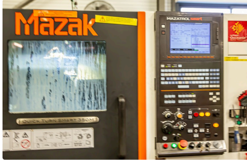
Machine japonaise acquise avec l'aide de la Région