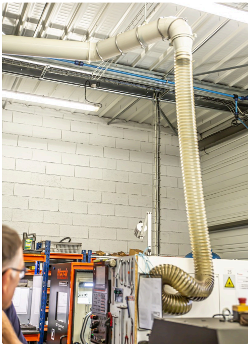
Evacuation des vapeurs d'huile