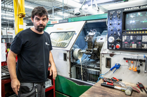
Un spécialiste montre sa machine