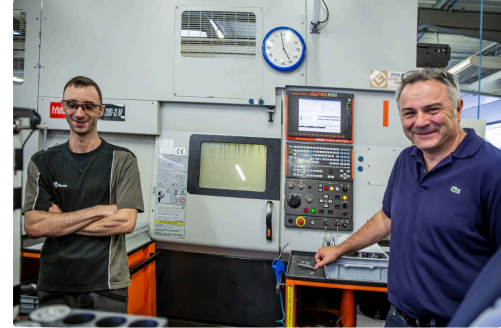
La visite continue