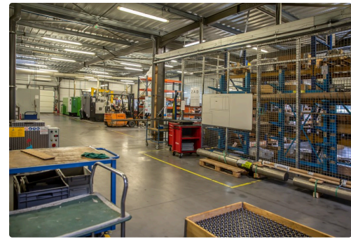
Intérieur de l'usine