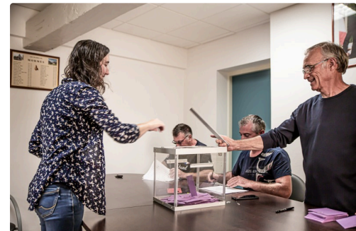
Une des dernières électorales