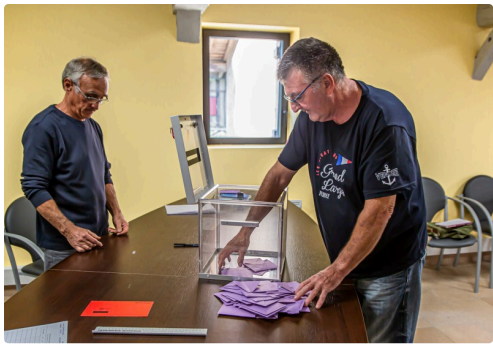
Ouverture de l'urne