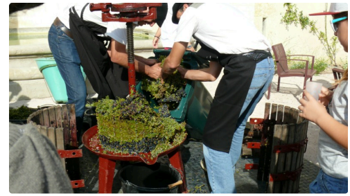
Les grappes ont été pressées.