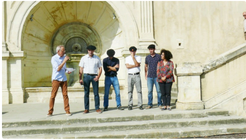
Les officiels lors des discours.