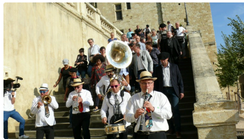
Descente vers la vigne en fanfare.