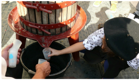
Les premières gouttes du jus de raisin.