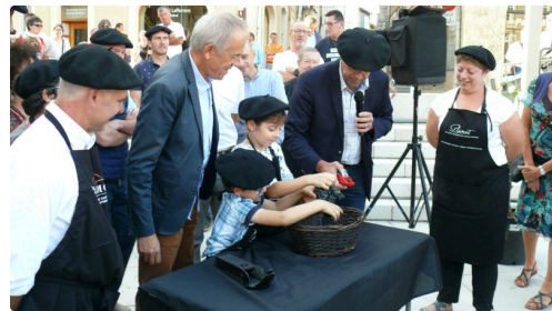
Les jeunes vignerons ont pressé du raisin pour en évaluer le degré.

« Aujourd'hui, il y a deux événements majeurs dans le monde, France-Argentine en rugby et ici, les premières vendanges à l'escalier monumental. Le vin est un lien avec les pays lointains », relatait le sénateur Franck Montaugé.