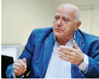
Le clin d'œil d'André Daguin

Tous les vendredis, vous avez rendez-vous avec André Daguin, figure emblématique des cultures et de la gastronomie gasconne. L'ancien chef étoilé, qui a rejoint le Cercle des Aficionados de PresseLib', prend sa plume pour vous.