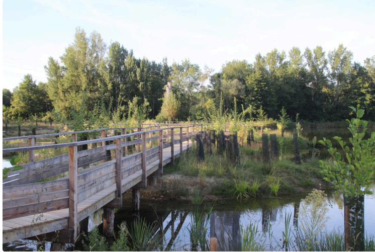
Un lieu de détente et de découverte de la nature