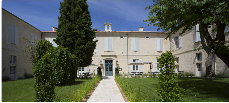
L'Hotel des Doctrinaires. La nouvelle belle adresse de Lectoure

Après deux longues années de travaux, l'Hôtel des Doctrinaires ouvre enfin ses chambres aux curistes, aux touristes et aux Lectourois en quête de bien-être et de confort