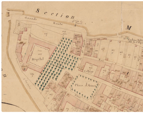
Cadastre-de-1824_3P LECTOURE 57.jpg