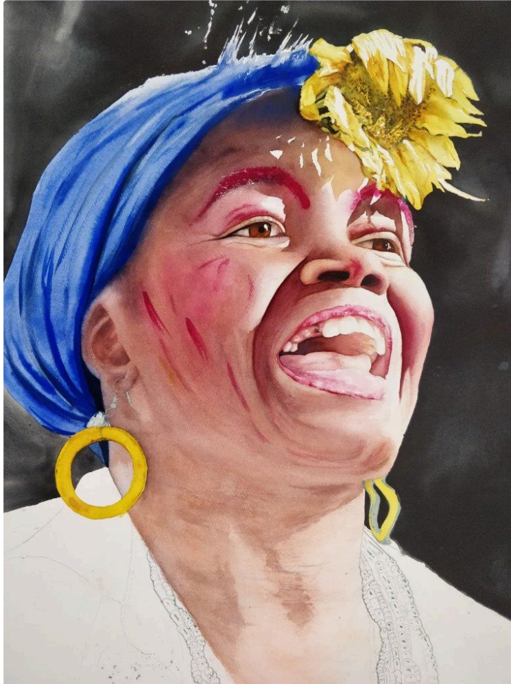
Dialogues à l'espace culturel de la Cavéa

Dans le cadre du Festival Valence Ton Slam !