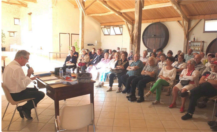
L'Algérie de 1830 à 1962