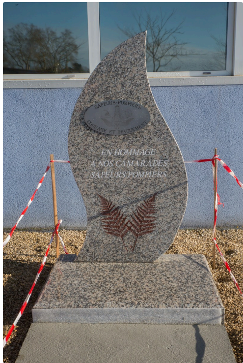
La stèle du CIS du Houga