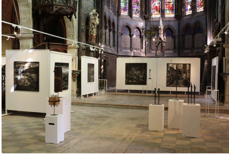
Une exposition à ne pas manquer

... dans le cadre splendide de l'église Saint-Michel