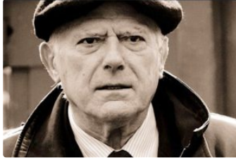
Le clin d'œil d'André Daguin

Tous les vendredis, vous avez rendez-vous avec André Daguin, figure emblématique des cultures et de la gastronomie gasconne. L'ancien chef étoilé, qui a rejoint le Cercle des Aficionados de PresseLib', prend sa plume pour vous.