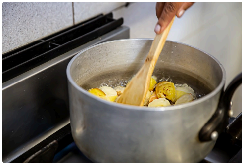
Les pommes sont écrasées