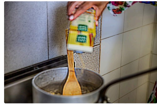
Addition de sucre