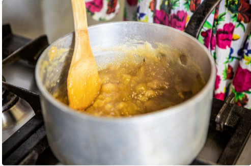
La compote est prête