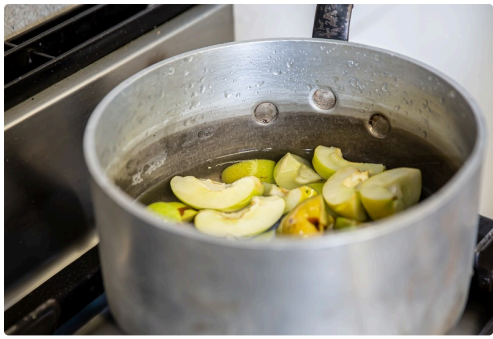
A la casserole