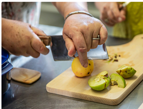
Découpage des pommes en quartiers