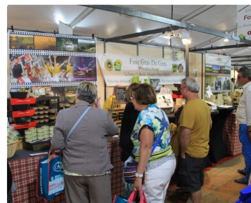
Des clients ravis de découvrir ces produits