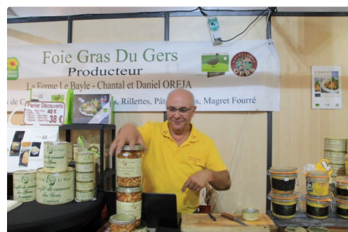
Un « ambassadeur » accueillant

Aujourd'hui, en parallèle de la foire, une fête foraine prend ses quartiers sur la place du foirail.