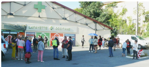
Les premiers soutiens sont arrivés dans la cour de la pharmacie.

C'est à 10 heures que la manifestation débuta avec une bonne cinquantaine de personnes qui ont rejoint vers 11 heures, le marché de la haute ville. C'est sur le parvis de la cathédrale que les discussions s'engagèrent entre les manifestants et les nombreuses personnes venues faire leurs courses du samedi. Des échanges cordiaux qui permirent de « regonfler tant soit peu le moral des salariés de la pharmacie » qui sont seize à attendre le résultat de l'appel suspensif déposé à la justice à Bordeaux, verdict le 25 octobre prochain.