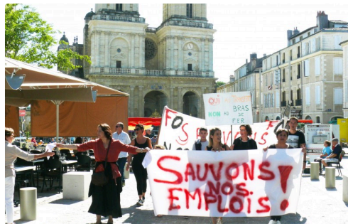
Retour des manifestants à la pharmacie Lafayette.