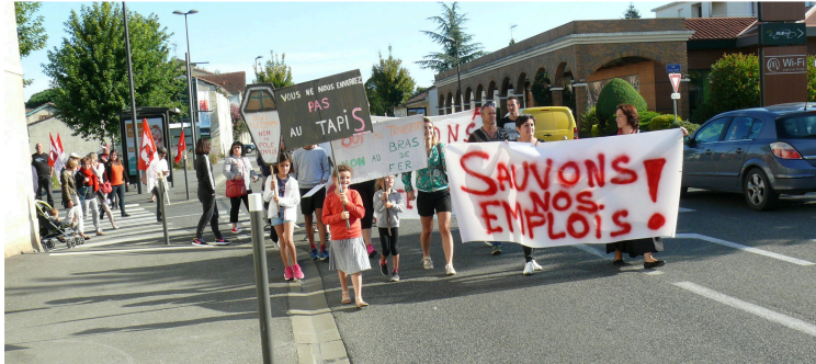
Les salariés de la pharmacie Lafayette ont manifesté dans les rues de la ville