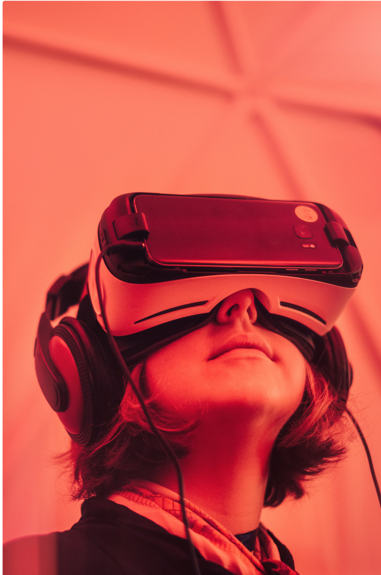
Le Digital, aussi un métier de femmes

La formation des jeunes filles aux métiers d'avenir