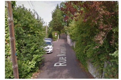
Avec 100 voitures de plus, ça va être juste !