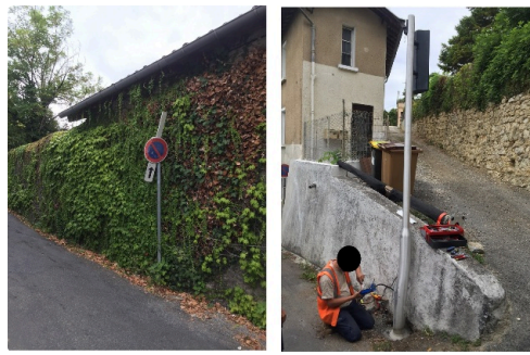
Ça passe juste ! Et seulement dans un sens !