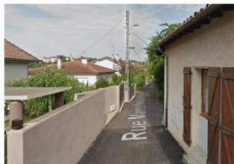
Montez sur le trottoir ! Et rentrez les fesses !!