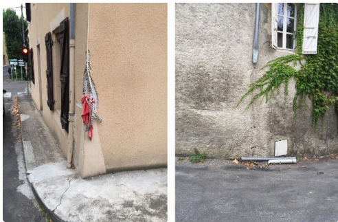
dangers_3 et 4.JPG